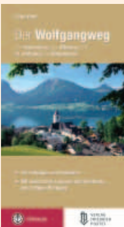
Der Wolfgangweg mit seiner Geschichte, den Legenden und der Wegbeschreibung für Wallfahrer-/Pilger von Regensburg über Altötting nach St. Wolfgang, erfasst von Dr. Peter Pfarl im Tyrolia Verlag.

Wolfgang war ein sehr beliebter Bischof, seine tiefe Religiosität, sein Reformwillen und der Einsatz für die arme Bevölkerung zeichnen ihn aus. Er war ein Europäer, seine Spuren reichen weit über die Bayerische Grenzen, in die Schweiz, Tschechien, Ungarn und viele Orte in Österreich und Bayern beziehen sich auf sein Wirken.